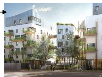
Projet ilot C : Brémond, 80 logements en accession

L'îlot D, faisant l'objet de l'appel à projet habitat participatif, peut accueillir jusqu'à 10 logements regroupés en un ou deux bâtiments de 6 et 4 logements, et 10 places de stationnement en rez-de-chaussée.