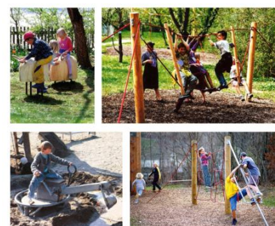
illustration des jeux pour enfants retenus