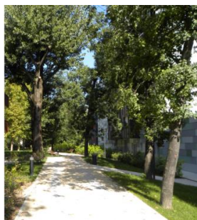
illustration de la future promenade plantée