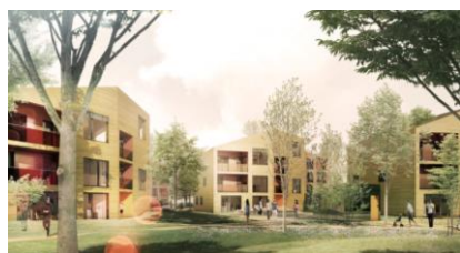
Projet ilot E : Atelier Gröll – Little Wood, 53 logements en accession